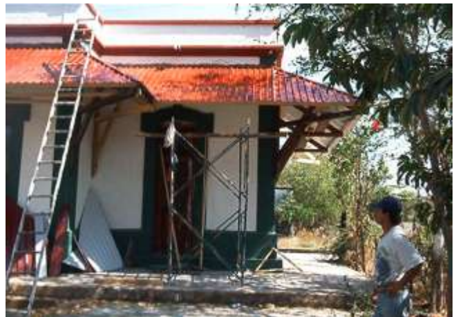
Estación Alzada, Colima