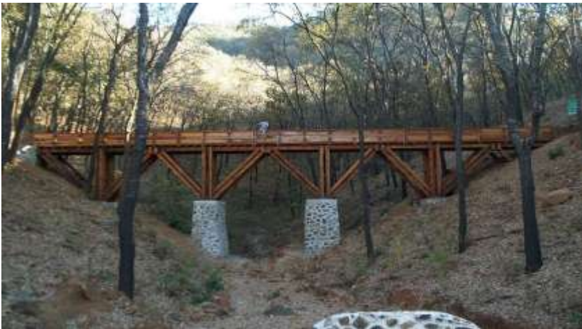
Puente Peatonal en Desarrollo Habitacional

RESERVA DE LOS ENCINOS Municipio de Teuchitlan , Jalisco