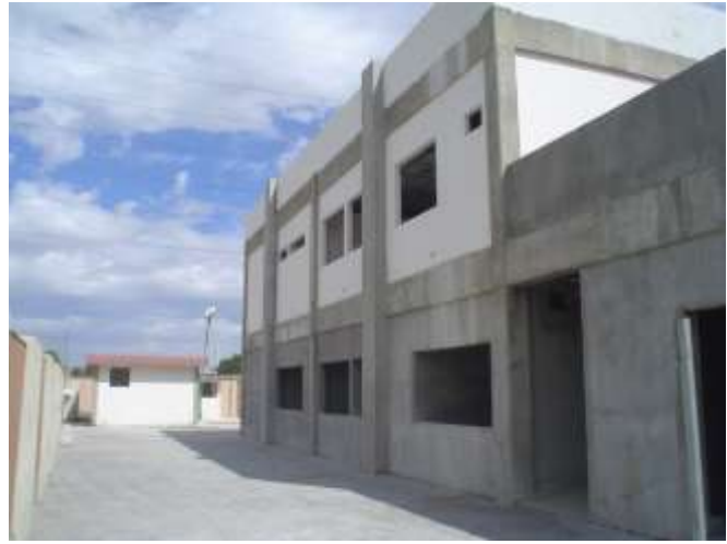
COMISION FEDERAL DE ELECTRICIDAD CONSTRUCCION DE EDIFICIO DE ATENCION AL CLIENTE; Guamúchil, Sinaloa