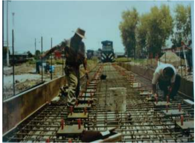
Patio del Taller de Reparaciones Pesadas, Casa Redonda Guadalajara, Jalisco