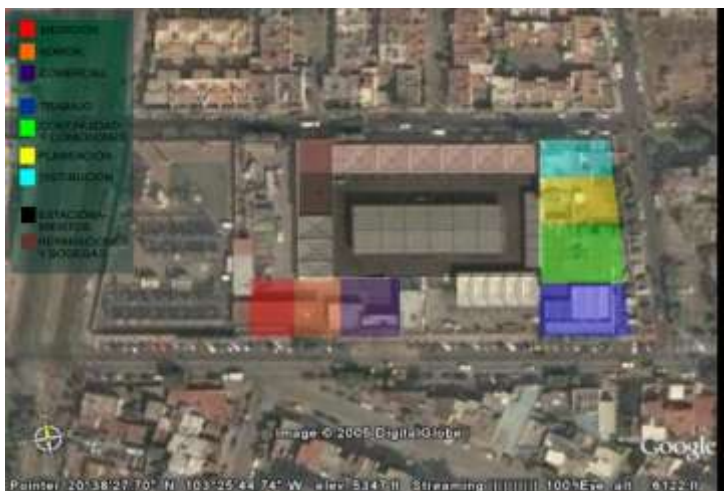
Comision Federal de Electricidad Desarrollo del anteproyecto de remodelación y ampliación de Sector Juárez, Zapopan, Jalisco