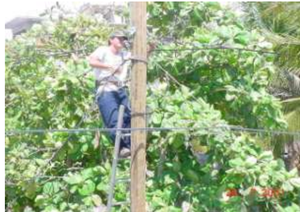
Distrito EZC 4/1, montaje de 120 Postes, Tendido y conexión de 8km de cable en desde 10 Ps hasta 300 Ps Mezcales, Nayarit

Proyectos y Construcciones Procisa, S.A. de C.V. Construcción de canalización: Construcción y/o montaje de pozos, ductos de PVC, reacondicionamiento de asfalto, concreto, adoquín, empedrado, etc. para redes telefónicas en Bucearías, Nayarit.