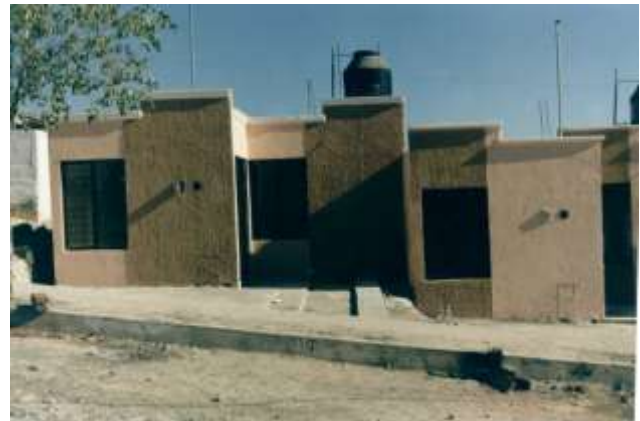
Conjunto habitacional El Plan, viviendas de interés social San Juan de los Lagos, Jalisco