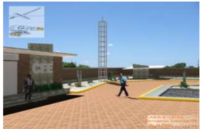
Comisión Federal de Electricidad Proyecto ejecutivo para la Subestación Tala, Jalisco