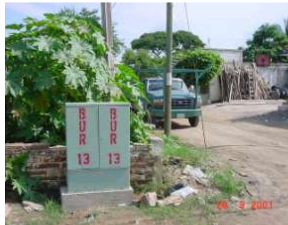
Construcción de canalización de aproximadamente 1,000 m., construcción de pozos y montaje de CD Bucerías, Nayarit