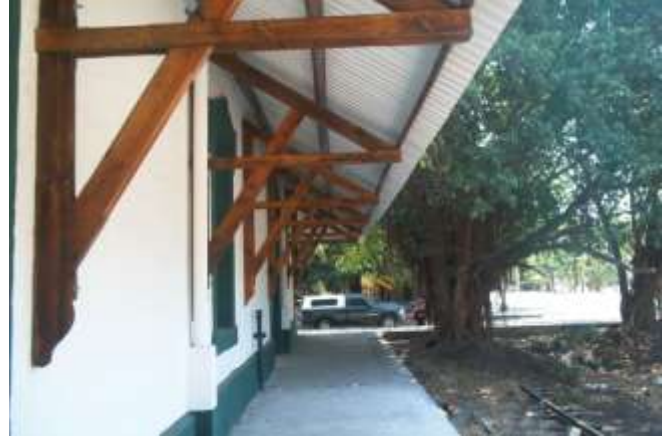
Restauración de estaciones de Ferrocarril Mexicano Estación de Carga de Colima, Colima