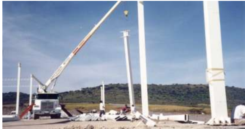
Planta DOVATRON Montaje de estructura metálica Tlajomulco de Zúñiga, Jalisco