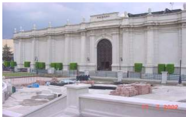
Inmobiliaria Macro, del Grupo Periódico Reforma Dirección de Construcción de la Plaza con 21,000 m2 de Plaza Reforma / Paradero Zapata Estacionamiento en dos sótanos y 24,000 m2 de oficinas y locales comerciales, México, D. F.