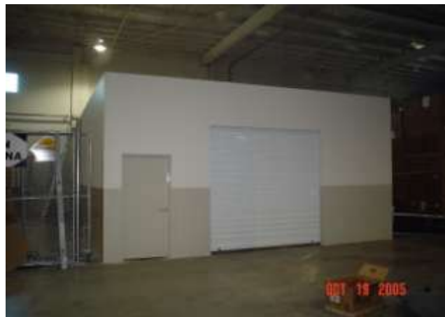
Construcción de Taller de Equipos Especiales en el Área de Almacén de Planta