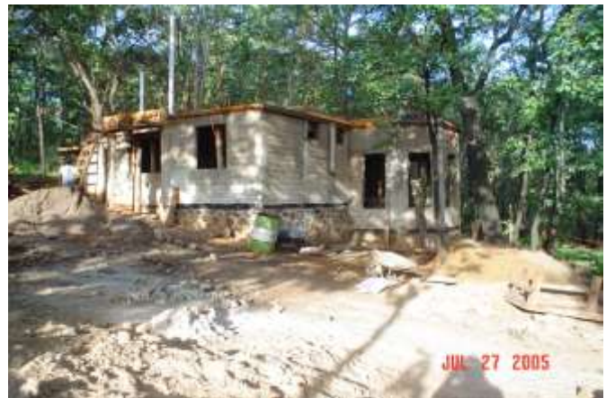
Construcción de vivienda en el fraccionamiento Reserva de los Encinos , Municipio de Teuchitlan, Jalisco