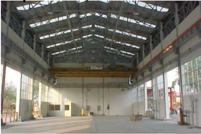
Restauración Talleres Locomotoras Gdl