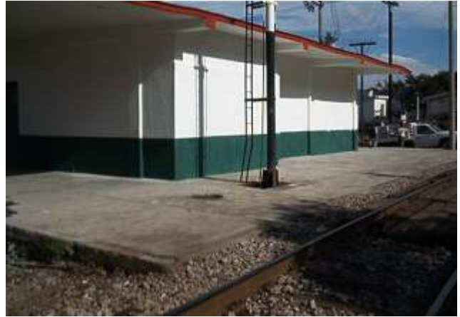
Restauración Estación Barrancas Nayarit