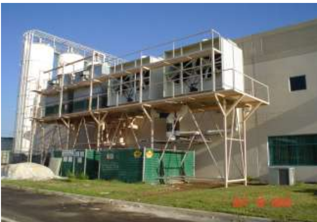
Construcción de Estructura de Torre para Unidades Enfriadoras de agua de proceso