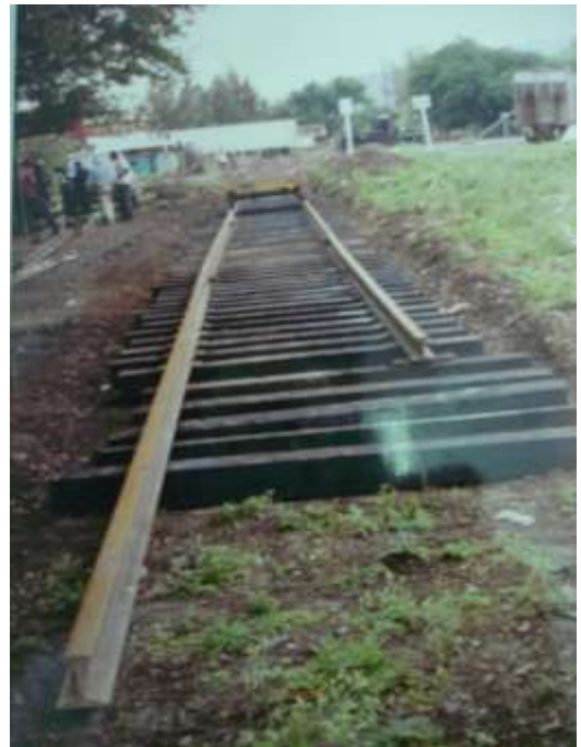
Construcción de Terracerías y Cambio de Durmiente y Tendido de Vías en patio de Ocotlán, Jalisco