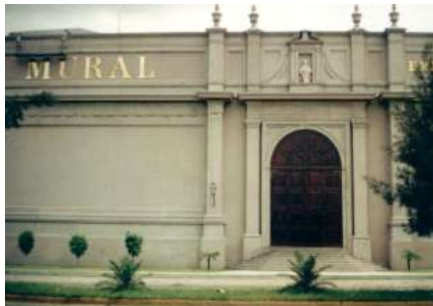
Dirección de Obra del edificio del "Periódico Mural" Zapopan, Jalisco