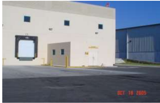
Reacondicionamiento De Toda La Cubierta De La Planta Y Construcción de Cuarto de Químicos