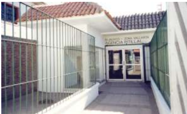
Puerto Vallarta, Jalisco