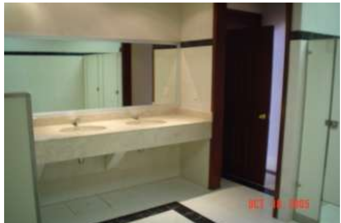
Remodelación de 2 Conjuntos Sanitarios y de Postgrado en Universidad de Valle de México, Guadalajara, Jalisco