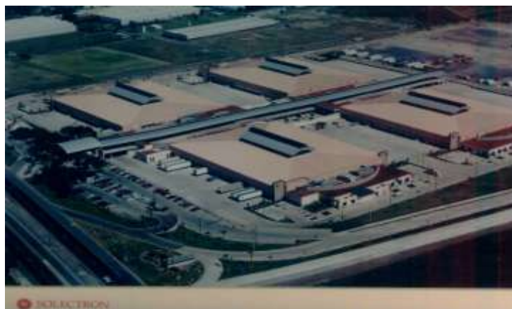
Dirección de obra para SOLECTRON DE MEXICO Tlajomulco de Zúñiga, Jalisco