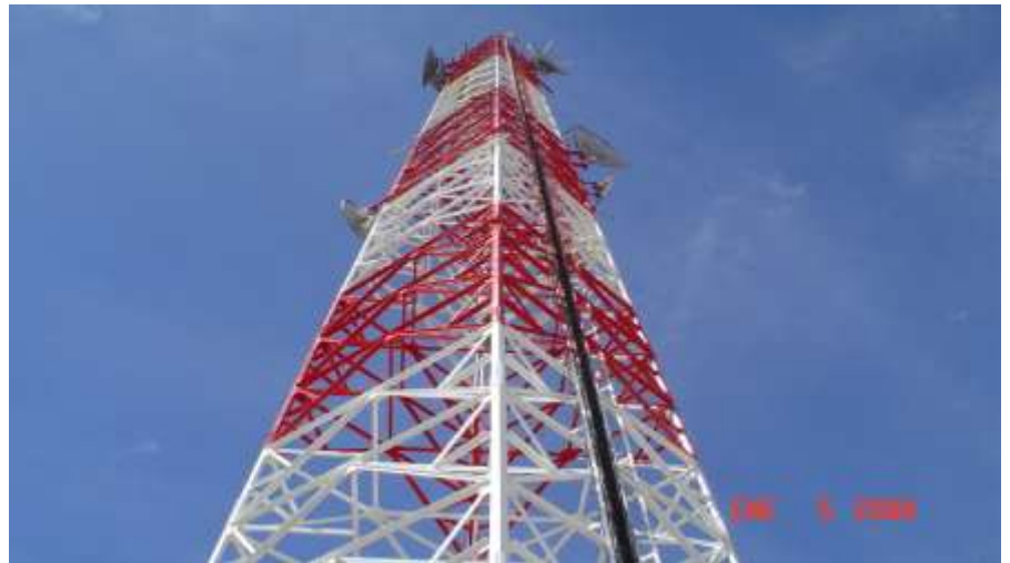
RENOVADO DE TORRE DE 60.00 MTS Torre Telecomunicaciones Celaya, Guanajuato