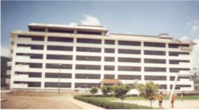
Construcción de Áreas Exteriores y Escalinata Ppal