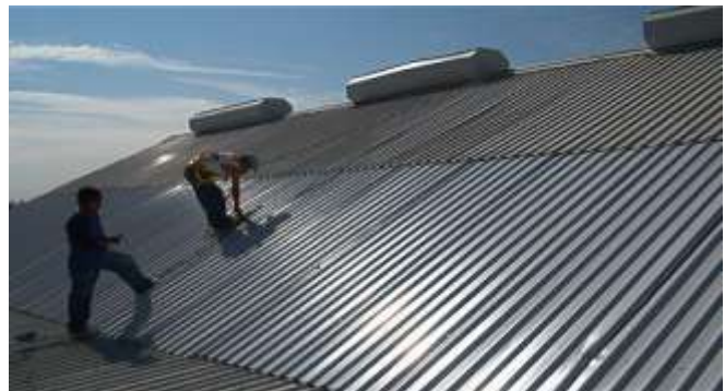
Reconstrucción de cubierta de almacén de materiales eléctricos, Ferrocarril Mexicano, S. A. De C. V.