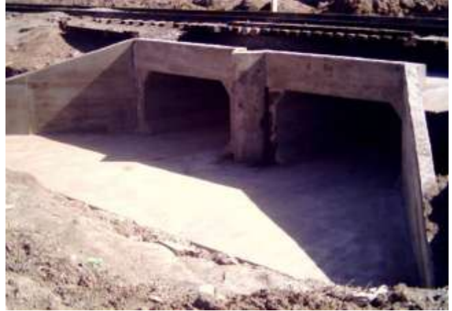
Construcción De 5 Puentes de Concreto En Vía Empalme – Nogales, Estado de Sonora Para Ferrocarril Mexicano, S. A. de C. V.