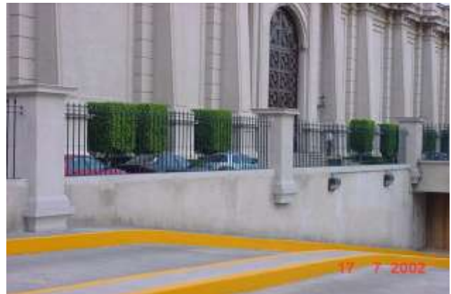
Vistas de Cercado perimetral de la Plaza Reforma