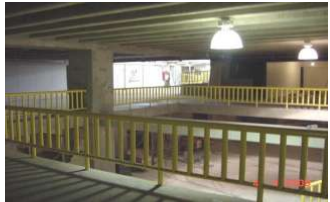
Vistas generales del Paradero y acceso al "Metro Zapata"